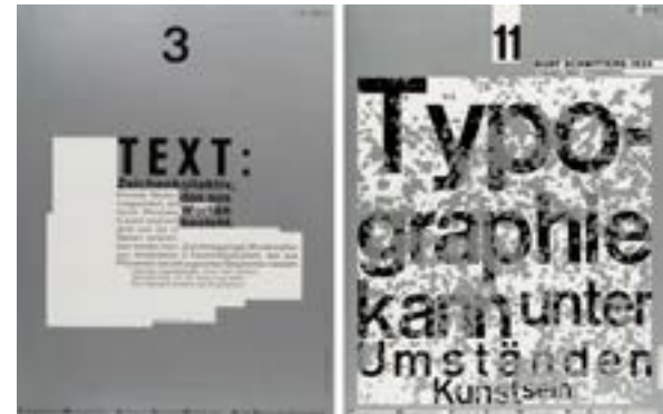
Wolfgang Weingart, Zeitschriftenumschläge, Typografische Monatsblätter Nr. 3 und 11, 1973

Übungen, Referat, Kurzprojekt, Dokumentation; benotet