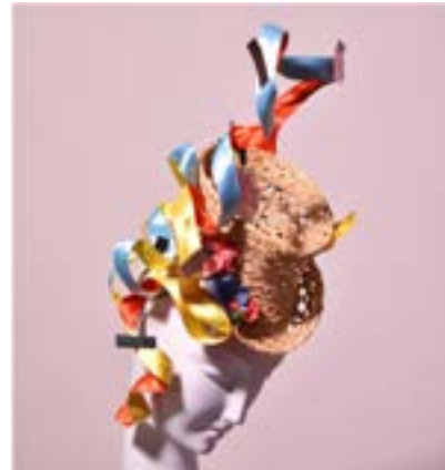
Stephen Jones, Straw Top Hat with Satin Ribbon & Flowers 2021.

regelmässige, aktive Teilnahme, Kurzreferat(e), praktische Studienarbeiten