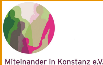
Miteinander in Konstanz e.V.