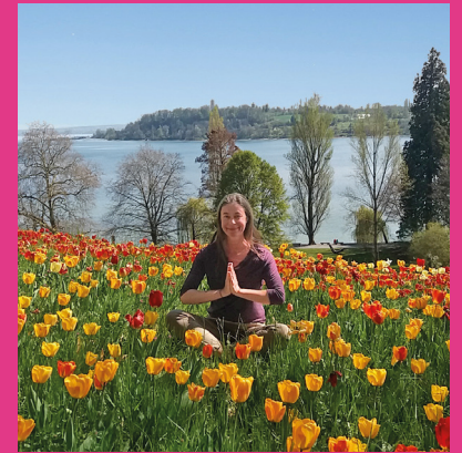
RGB